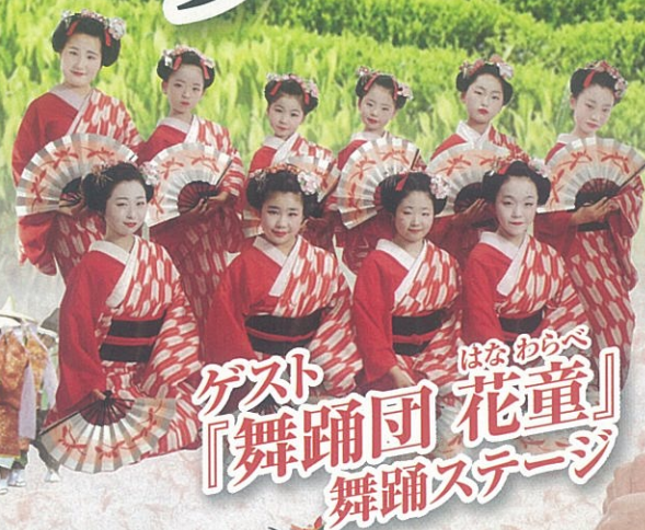
ゲスト 『舞踊団 花童』 舞踊ステージ